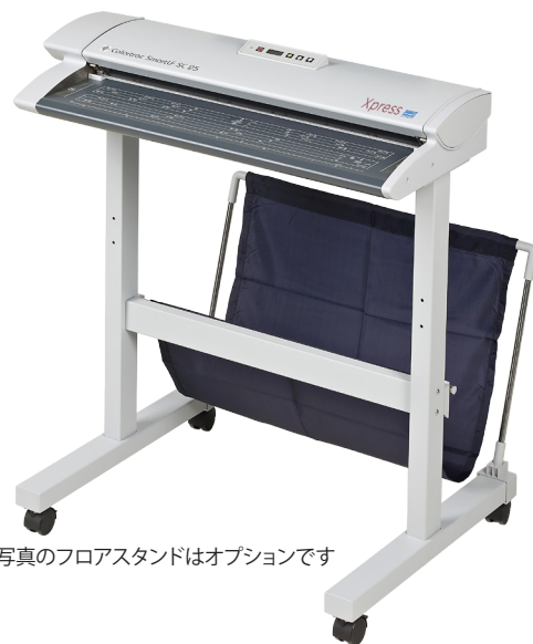
写真のフロアスタンドはオプションです

2方向から原稿に最適な光を照射するデュアルLEDと全読み取り範囲をカバーする一体化したユニットに格納されたシングルセンサー(米国特許取得)によって、複数センサー間のズレや光量のばらつきによって起こる様々な問題を解決し、品質の高いスキャンングを実現します。